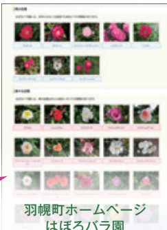
羽幌町ホームページ はぼろバラ園 「バラ図鑑」

はぼろバラ園で鑑賞できるバラ の名前や開花状況、希少品種の 咲いている場所などの詳しい情 報をご覧いただけます。