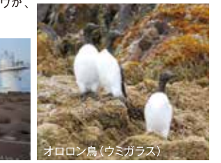
オロロン鳥(ウミガラス)