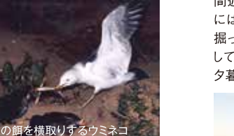
ウトウの餌を横取りするウミネコ