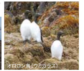
オロロン鳥(ウミガラス)